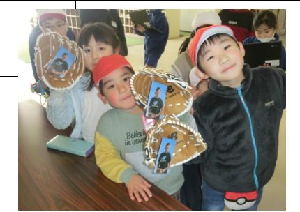
大谷翔平選手からのグローブが届きました。これから活用していきます。

2 1月21日(日)ふれあいの会のクリーン作戦が行われました。あいにくの大雨でゴミ拾いはできませんでしたが、たくさんの方が集まっていて、大和田地区の団結力の大きさを感じました。大和田小学校の教職員も一緒に参加させていただきました。雨で寒い中、お疲れ様でした。